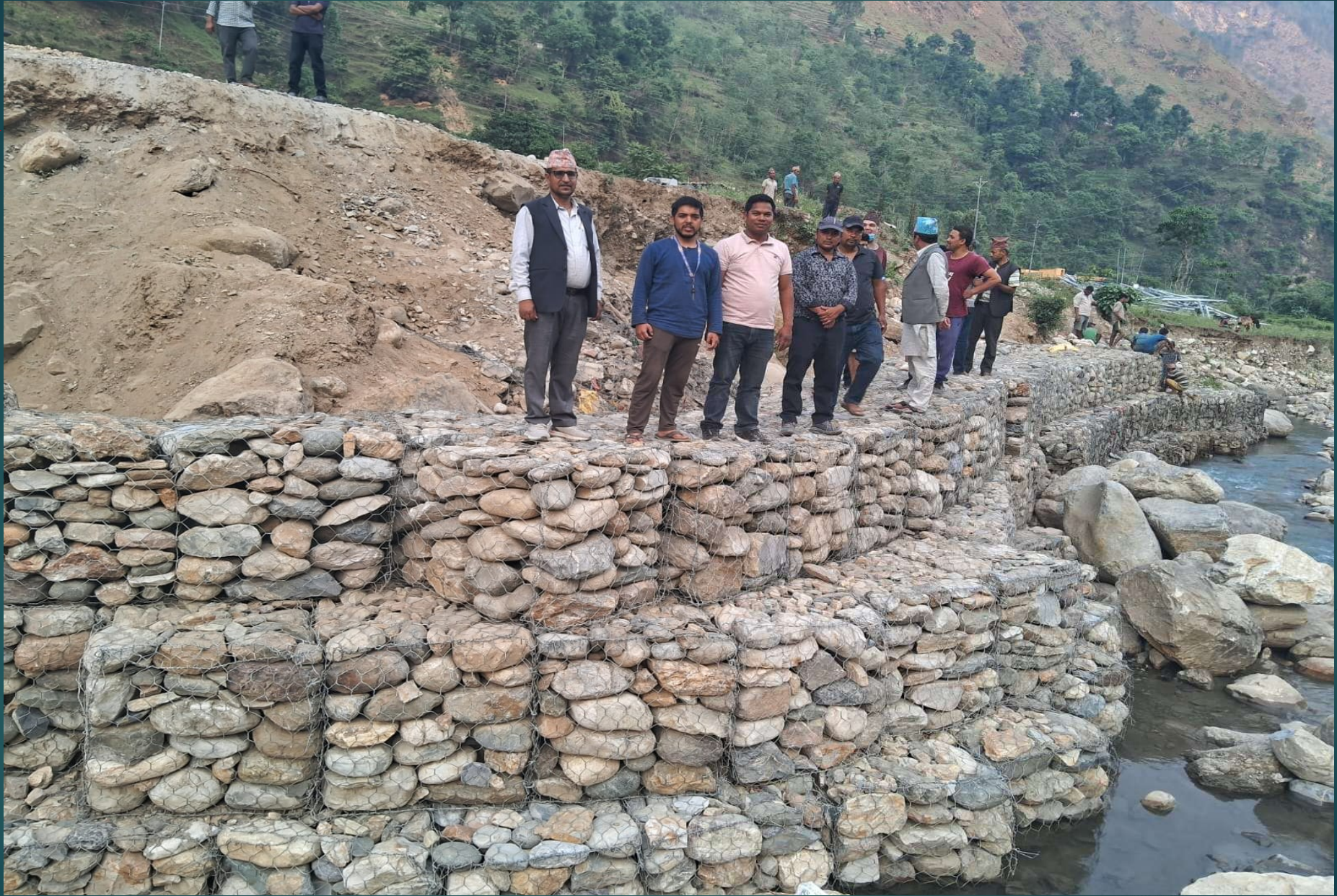
बागथला RCC तटबन्धन