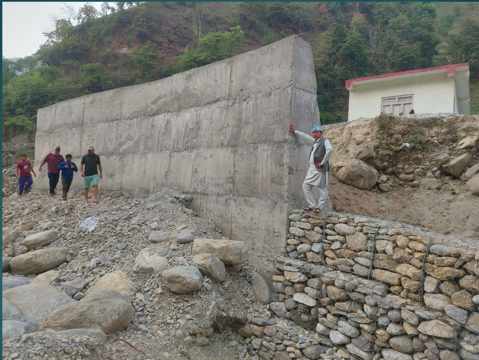
बागथला RCC तटबन्धन